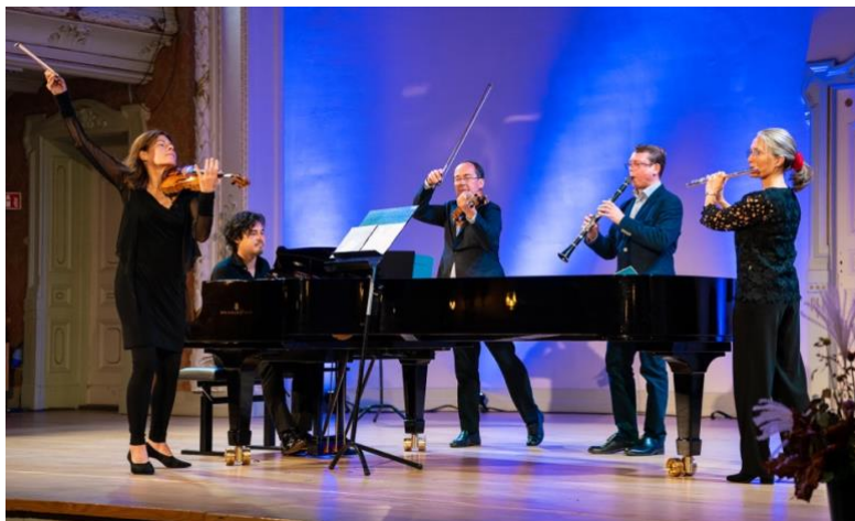
Kammerkonsert i logen.

Alt i alt: Trondheim kammermusikkfestival viste igjen at den er kunstnerisk i front både nasjonalt og internasjonalt. Årets program er helt på høyde med det store festspill/festivaler ute i verden leverer.