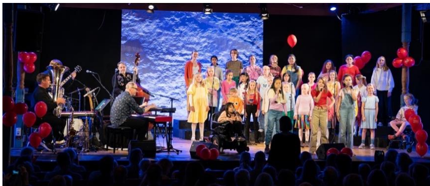
Sangfoni, Fabelaktig formiddag.