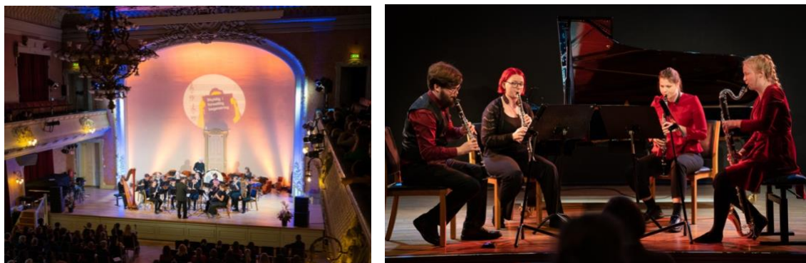
Talentlørdag, Frimurerlogen (venstre) og Dokkhuset (høyre).

Vi lyktes godt med å involvere barn og unge som utøvere, som frivillige og som publikum.