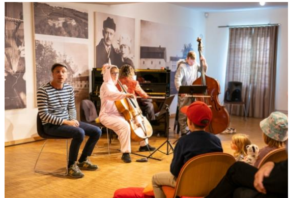
0-100, Fabelaktig formiddag.