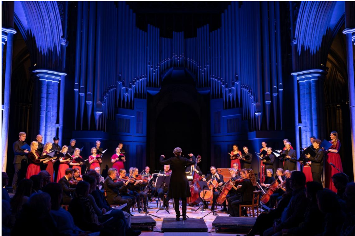
Nattkonsert i domene.