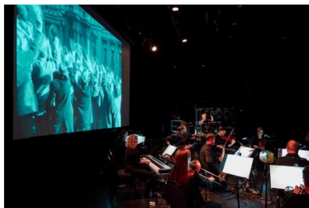
Die Stadt ohne Juden.