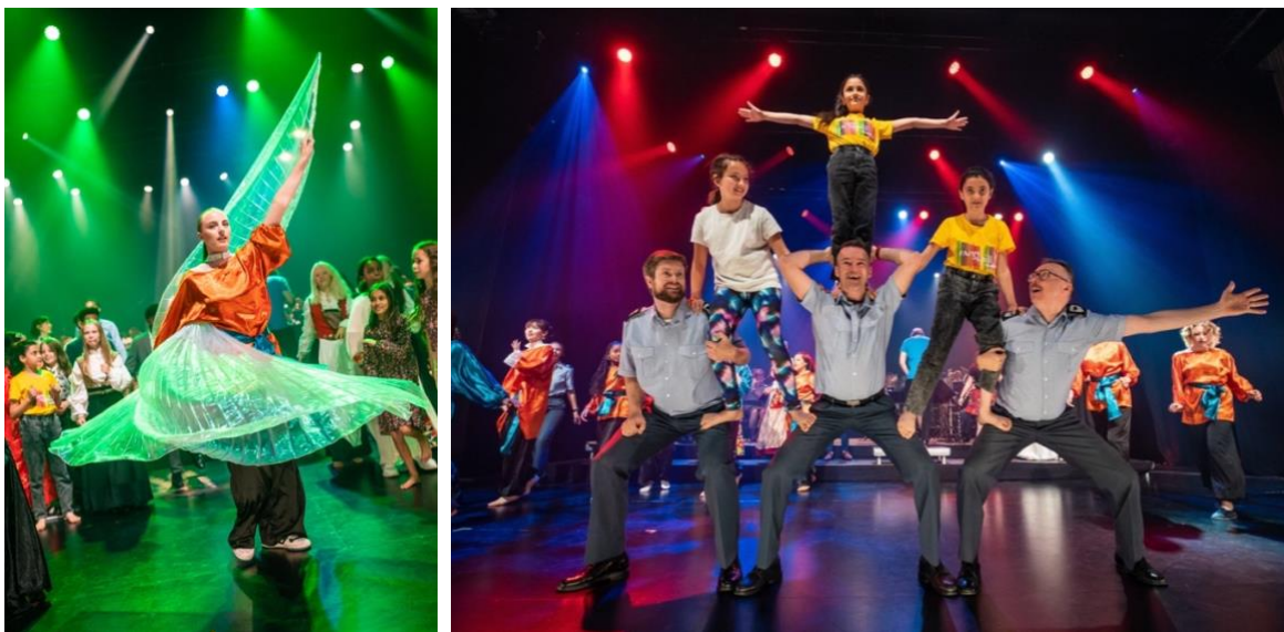
Fargespill og Luftforsvarets musikkorps.

Dokumentaren som ble produsert i forbindelse med 10-årsjubileet i 2021 ble lansert på YouTube og ble vist på Trønder-TV. Filmen er også brukt i et undervisningsopplegg som turnerer på 9.trinn for Den kulturelle skolesekken høsten 2022. Det ble laget en kortversjon av dokumentaren som har vært svært nyttig for å gi en rask introduksjon til prosjektet i møte med nye samarbeidspartnere.