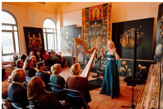
Hjemme hos Gullvåg.

Selv om Hjemme-hos-serien har blitt gjennomført hvert år siden 2014, virker det ikke som om idéen har gått ut på dato. Alle konsertene ble utsolgt og hadde en stor andel nytt publikum. Opplevelsen av å komme tett på musikken fører forhåpentligvis til at de kommer på andre festivalkonserter også.