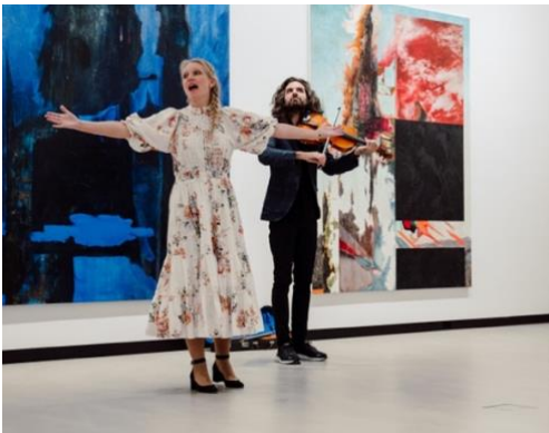
Åpningsdag: Vandrekonsert på K-U-K.

For første gang hadde festivalen en tydelig 8-dagers festival søndag-søndag med en omfattende åpningsdag den første søndagen. En slik åpningsdag fungerte utmerket, ikke minst siden både Fabelaktig formiddag på Ringve og Vandrekonserten på K-U-K ble store suksesser. Kunsthuset K-U-K har kommet inn som et frisk pust i bybildet og har – som Kamfest – fokus på unge talenter. I tillegg var det en fin måte å vise hva god kammermusikk kan være, unike opplevelser i små rom hvor man kommer tett på kunsten og musikerne.