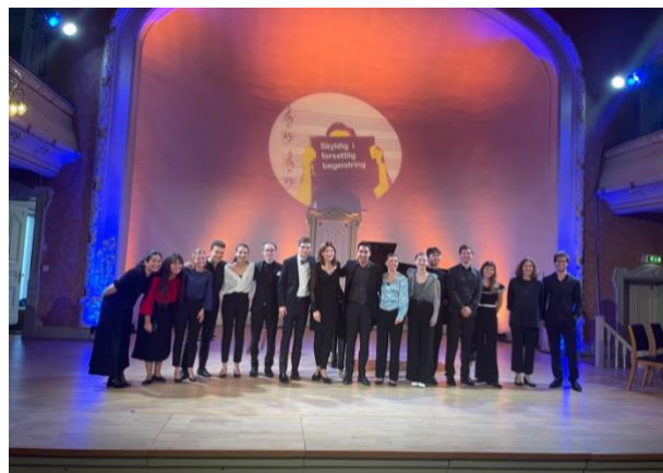
Akademiets avslutningskonsert.