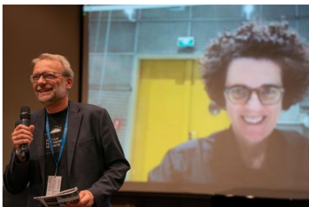
Møt festivalkomponisten.

For andre år på rad kunne festivalkomponisten dessverre ikke være til stede, denne gang grunnet helsemessige årsaker. Det ble likevel en fin og helhetlig presentasjon av komponist Olga Neuwirth. Totalt ble ni verk av henne framført under festivalen. Stumfilmkonserten “Die Stadt ohne Juden” (i samarbeid med Trondheim Sinfonietta, Jødisk kulturfestival og Cinemateket) og verdenspremieren med TSO (Dobbelkonsert for cello, slagverk og orkester) må trekkes fram spesielt. I tillegg var konserten “100% Neuwirth” et godt eksempel på at Kamfest er med på å gi lokale musikere inspirerende prosjekter – noe som er utviklende for hele kulturlivet i regionen. Neuwirth lagde en hilsen til publikum som ble avspilt før TSO-konserten, og hun var til stede digitalt på seminaret Møt komponisten (se bildet).