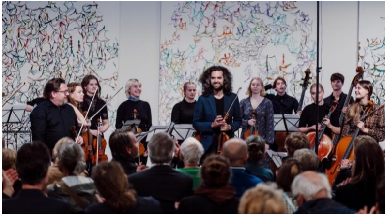
Åpningsdag: Vandrekonsert på K-U-K.

suksess og snakkis blant festivalpublikum. JuniorSolistene var et forrykende høydepunkt med urfremføring av den unge komponisten Ingrid Steinkopf. Her levde festivalen virkelig opp til målsettingen om å overraske og utfordre.